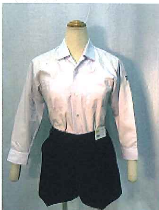
★ 男子ワイシャツ・半ズボン