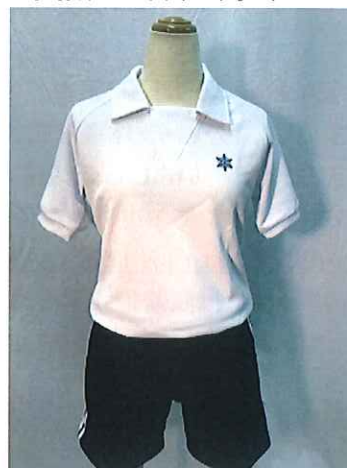
★ 運動着 半袖クルーネック クォーターパンツ